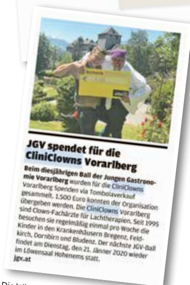
Die Wirtschaft (Vorarlberg)